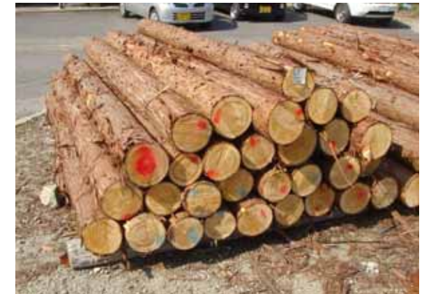
万賀地区の西山から伐り出されたヒノキの50年生。二番玉30本、長さ3m、末口16~18cm、材積2.67m 3 。1m 3 あたり27,000円で落札されました。この一棚で72,090円になりました。(9月7日の木材市)