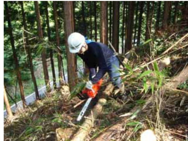
美しい森林づくりには、適時の間伐が不可欠です！

美しい森林を造ることは地域の環境はもちろん、地球環境の改善にも貢献します。現在、間伐事業に多くの補助金があり自己資金は必要ありませんので、この機会に「美しい森林づくり」をお願いします。