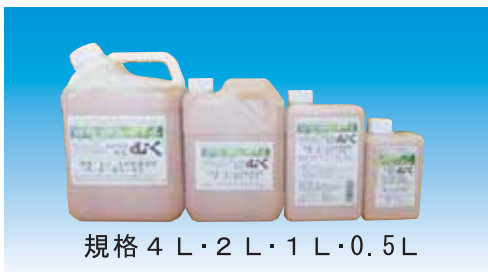
規格 4 L・2 L・1 L・0.5 L